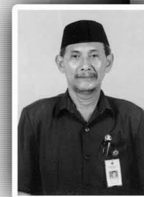
Oleh : Nono Hariyono, S.Pd., M.Pd. *)

Pak Guru Bakri baru saja menerima gaji dari bendahara sekolah, setelah dihitung dengan cermat dan dengan jumlah yang benar dan tepat, Si Guru ngeloyor begitu saja dari meja bendahara, tanpa berkata ba atau bi. Hal yang sama diikuti oleh Pak Guru Sidi, Bu Guru Sinta dan teman temannya yang lain.