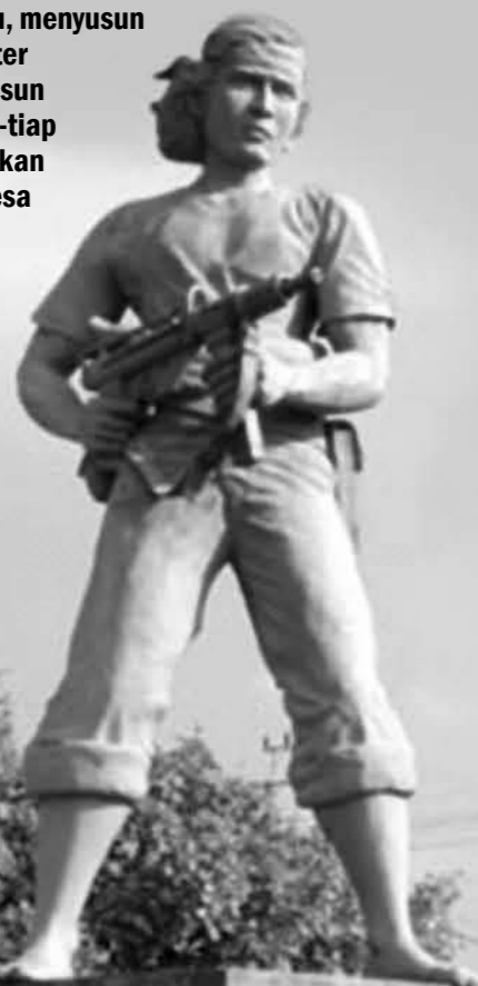
► Monumen/ Patung Kadet Soewoko

Di tahun 1948, saat itu Belanda melancarkan agresi militer ke-2 di Indonesia melalui laut dan udara. Untuk daerah Lamongan tentara Belanda masuk lewat pantai utara Jawa yaitu wilayah Brondong. Menghadapi hal tersebut Tentara Nasional Indonesia menjalankan taktik gerilya dengan mengangkat beberapa Komandan Operasi Daerah Militer baru, menyusun Pemerintahan Militer Kecamatan, menyusun kader-kader di tiap-tiap desa dan menggiatkan Pasukan Gerilya Desa (Pager Desa).