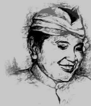
Oleh: Warjito, S.Pd. *)