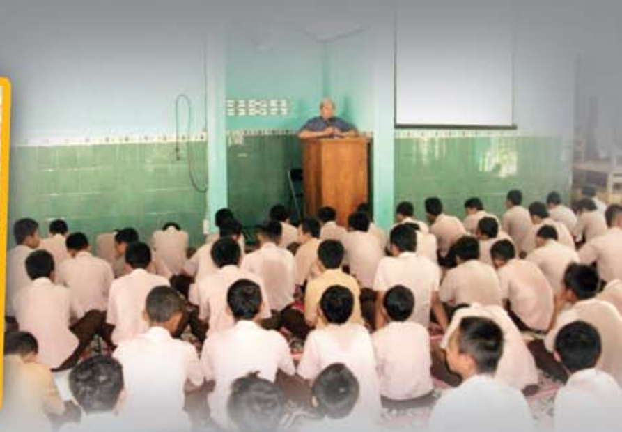
▲ Siswa khusyuk mendengarkan khotbah jum'at di Sekolah SMPN 1 Mantup.