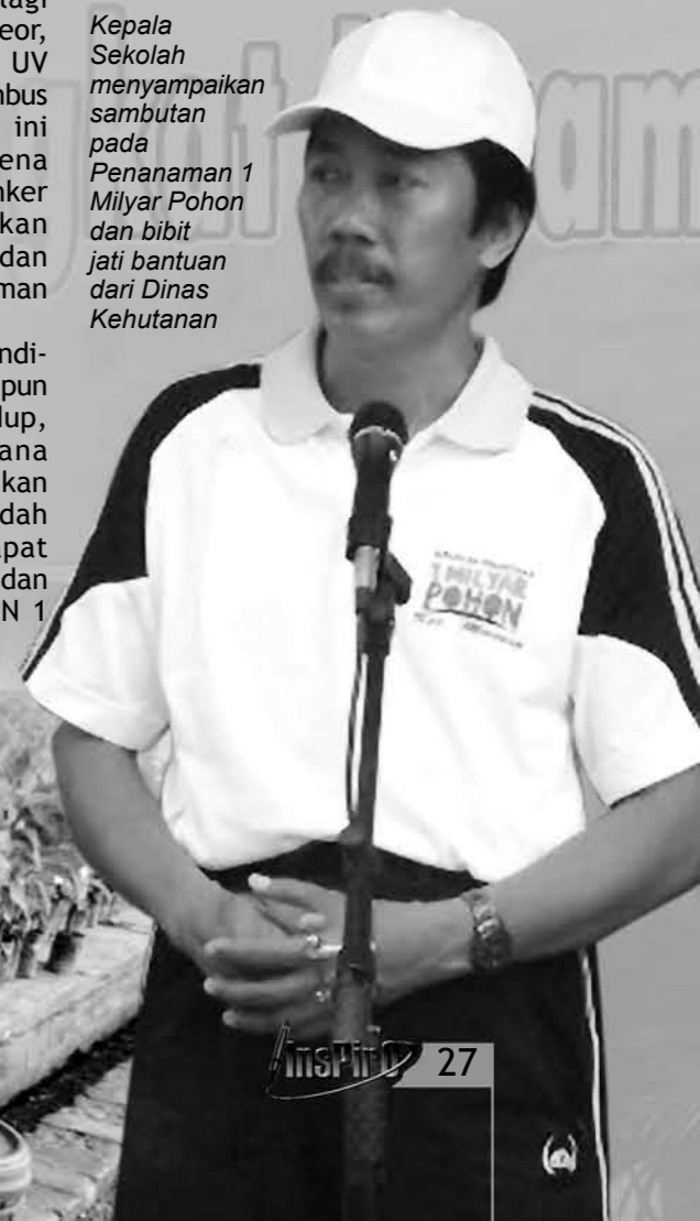
Kepala Sekolah menyampaikan sambutan pada Penanaman 1 Milyar Pohon dan bibit jati bantuan dari Dinas Kehutanan