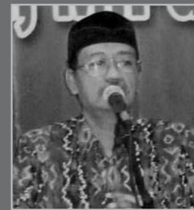
Oleh: Mahfudz, S.Pd.I. *)

Jawab Iblis - "Ya Rasulullah! Inilah bencana yang paling besar bahayanya. Apabila masuk awal bulan Ramadhan, maka memancarliah cahaya Arasy, bahkan sekalian Malaikat menyambut dengan kesukaan. Bagi orang yang berpuasa, Allah akan mengampunkan segala dosa yang lalu dan digantikan dengan pahala yang amat besar serta tidak dicatat dosanya selama dia berpuasa. Yang menghancurkan hati kami ialah segala isi langit dan bumi; yakni Malaikat, bulan, bintang, burung dan ikan-ikan semuanya siang malam mendoakan keampunan orang yang berpuasa. Satu lagi kemuliaan