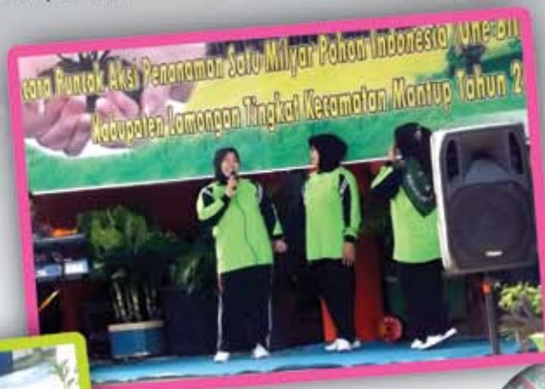
◀ Berbagai aktivitas guru menyemarakkan acara Green and Clean School.