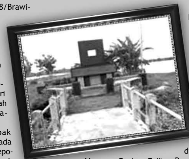
Monumen Banteng Putih di Gumantuk

Musuh seketika tidak menunjukkan reaksi, mereka seperti terpaku diam tidak melakukan gerakan sedikit pun. Baru beberapa saat kemudian dua pucuk senapan mesin berat yang dipasang pada bak belakang kedua kendaraan dengan gencar melakukan tembakan