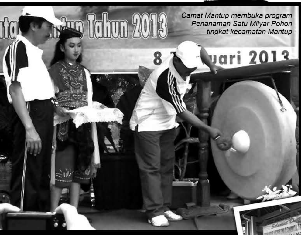
Camat Mantup membuka program Penanaman Satu Milyar Pohon tingkat kecamatan Mantup

e. Pengolahan sampah organik dan anorganik serta daur ulang.