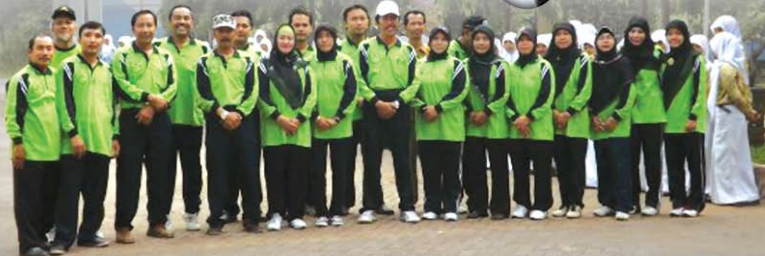
Kepala Sekolah dan Guru bersatu tekad mewujudkan Green and Clean School.