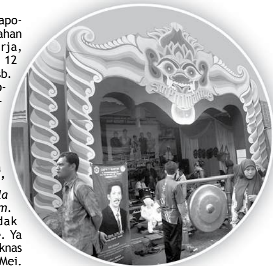
Stand SMPN 1 Mantup

Kegiatan lainnya adalah pameran pendidikan, sukurlah kita dapat stand nomor 39. Apa yang dipamerkan? Ada deh... ada gantungan kunci buatan siswa-siswi SMP N 1 Mantup, ada karya berbahan dasar daur ulang daun dan