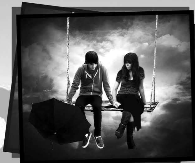
Oleh: Erika Fajar Pratama / VIII A*)

Malam harinya, pada saat belajar, aku teringat dia terus. Belajar jadi gak konsentrasi hatiku bimbang, gak bisa tidur... eh... paginya aku terlambat bangun .... di rumah