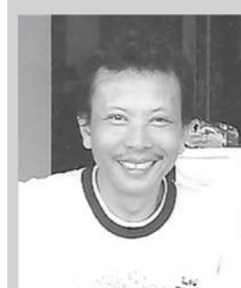
Oleh: Jampi, S.Pd. *

Bila kita isi ulang menggunakan spuit maka yang dapat terjadi tinta akan mengumpul dibagian bawah dari cartridge. Hal ini dapat mengakibatkan tinta menjadi berlebih dan merembes keluar secara berlebihan yang mengakibatkan terjadinya korsluiting pada cartridge. Cartridge menjadi rusak.