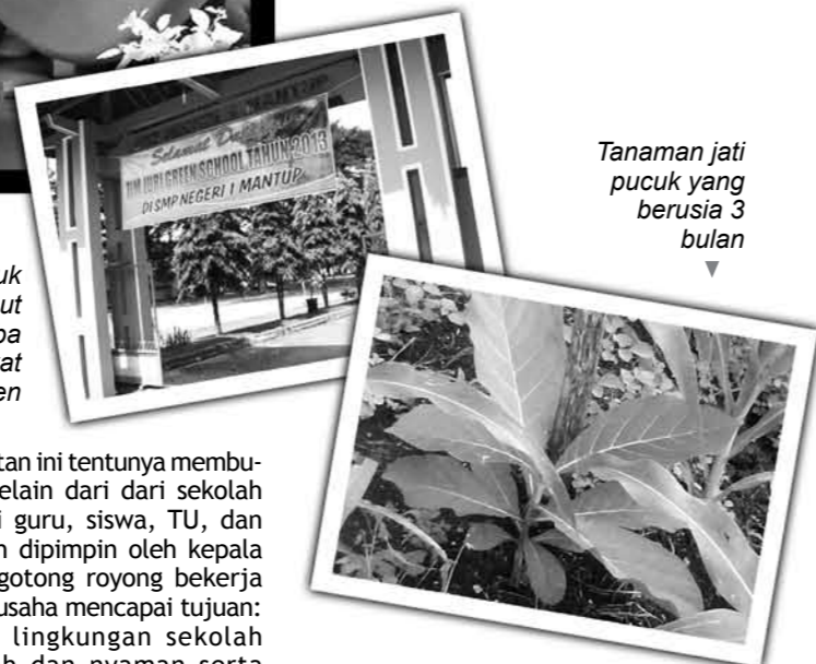
Spanduk menyambut juri Lomba Adiwiyata tingkat kabupaten