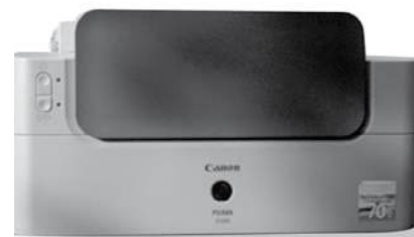
Gb. 2. Printer terlihat utuh tidak cacat.