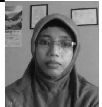
Oleh: Wulandari Eka Sukma, S.Kom. *)

Yang pasti, kecepatan MRAM mencapai 10 kali lipat kecepatan RAM. Kecepatan ini masih bisa terus dikembangkan dimasa depan. *) Mengajar TIK