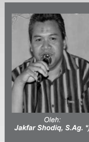
Oleh: Jakfar Shodiq, S.Ag. *)