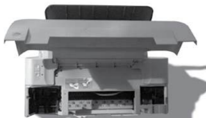
Gb. 1. Bagian diatas cartridge dihilangkan.