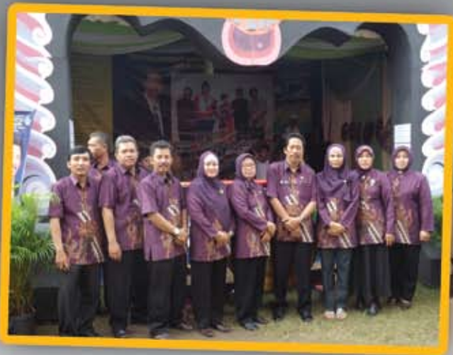
▲ Kepala Sekolah dan Guru berpose di depan stand pameran SMPN 1 Mantup.