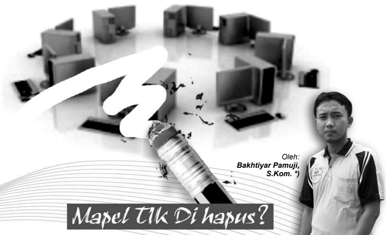
Oleh: Bakhtiyar Pamuji, S.Kom. *)